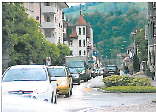
Das Verkehrsaufkommen zu Stosszeiten ist in Wolhusen gross.

Die IG Umfahrung Wolhusen fügt aber an: Die IG hält an ihrer Forderung nach einer raschen Planung und Realisierung der Südumfahrung Wolhusen und Aufnahme des gesamten Betrages in Topf B des Strassenbauprogramms 2015 bis 2018 fest. [pd/EA]