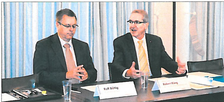
Regierungsrat Robert Küng (rechts) und Kantonsingenieur Rolf Bättig informieren über das Bauprogramm 2015 bis 2018.

Regierungsrat Robert Küng, Vorsteher des Bau-, Umwelt- und Wirtschaftsdepartements, sowie Rolf Bättig, Kantonsingenieur und Leiter der Dienststelle Verkehr und Infrastruktur (vi), stellten am Mittwoch im Regierungsgebäude einige Projekte aus dem neuen Bauprogramm vor, das gleichzeitig in die Vernehmlassung geschickt wurde. Die einzelnen Projekte werden wie gehabt nach Priorisierung in die Topfe A, B und C eingegliedert. Projekte aus dem Topf A sind Vorhaben, die sich für die Periode von 2015 bis 2018 bereits in der Planung oder in der Ausführung befinden. «Topf-A-Projekte sind der eigentliche Programminhalt, über welche verbindlich beschlossen wird», erklärte Kantonsingenieur Rolf Bättig. Der Topf B sei diesen nachgelagert und Topf C käme noch weiter hinten.