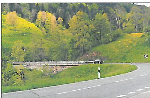
Die Chrutacherbrücke, beim Ausgang der Lammschlucht, soll am bisherigen Standort gebaut werden.